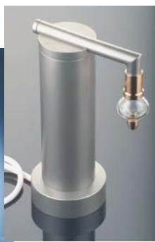
Leitungswasser gefiltert und gewirbelt