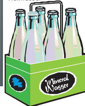
Mineral- und Heilwasser